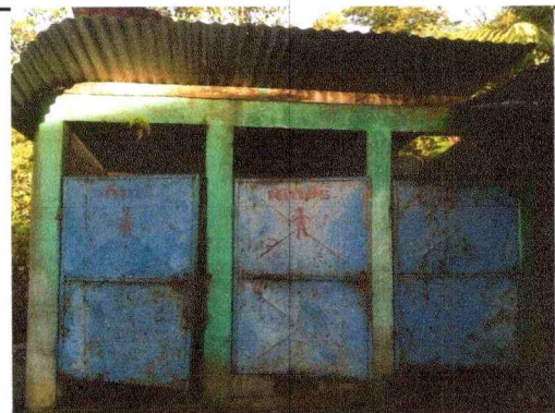
Foto 3: Sustitucion de puertas y techo del servicio sanitario del nivel primario.